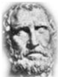
Anaxímenes (Sucesor de Anaximandro) EL AIRE