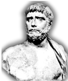
Tales de Mileto (Uno de los siete sabios) EL AGUA

Los primeros físicos o cosmólogos decían que para hablar de conocimiento era necesario que haya permanencia en la realidad. Buscaban algo que estuviera detrás de todos los cambios, que se encontrará en toda la realidad. Buscaban un principio de todas las cosas. Buscaban el ARJÉ.