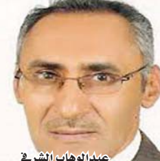
عبد الوهاب الشرفي

أعلنت كوريا الشمالية، اليوم السبت 21 أبريل، تعليق تجاربها النووية والصاروخية قائلة إنها ستهدم موقعا لتلك التجارب في شمال البلاد، وأنها لم تعد بحاجة إليها. ينتظر العالم اللقاء الذي يوصف بالتاريخي وسيجمع الزعيم الكوري الشمالي "كيم أون" بالرئيس الأمريكي "ترامب" وهو اجتماع ملفت بالفعل بعد حالة من التوتر العالية والتصريحات النارية المتبادلة بين الطرفين على خلفية برنامج كوريا الشمالية لتطوير الأسلحة النووية، وقبل هذا اللقاء تفاجئ كوريا الشمالية الجميع بالاعلان عن تعليق تجاربها النووية والصاروخية.