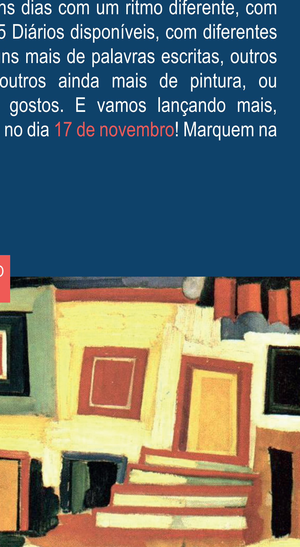
AMADEO DE SOUZA CARDOSO Dançarino (1910)

A participação tem sido muito viva e abundante. Maria é uma figura clássica na tradição cristã, o que significa que enquanto símbolo de fé, ela possui uma permanência e um significado pessoal nas nossas vidas como poucas outras figuras. É natural (e desejável) que surjam questões, confusões e novos olhares e tem sido uma delícia seguir o fórum do curso, repleto de partilhas e discussões entre os participantes.