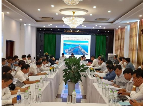
Toàn cảnh Hội nghị giao ban đầu tư nước ngoài khu vực miền Trung – Tây Nguyên năm 2020 tại Quy Nhơn, Bình Định

quan, đơn vị quản lý, xúc tiến đầu tư (XTĐT) thuộc 13 địa phương khu vực miền Trung – Tây Nguyên.